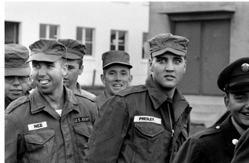
Elvis Presley in Friedberg, Hessen 1958