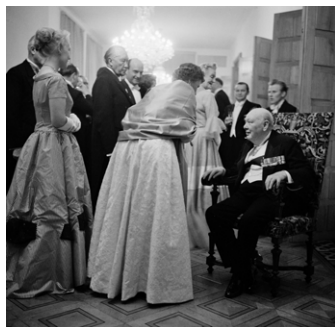
Konrad Adenauer empfängt Winston Churchill im Palais Schaumburg, Bonn 1956