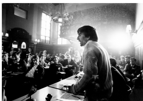
Rudi Dutschke während seiner Rede in der Karls-Universität, Prag 1968