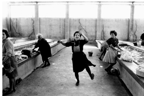
Wäscherinnen in Cullera, Spanien 1964