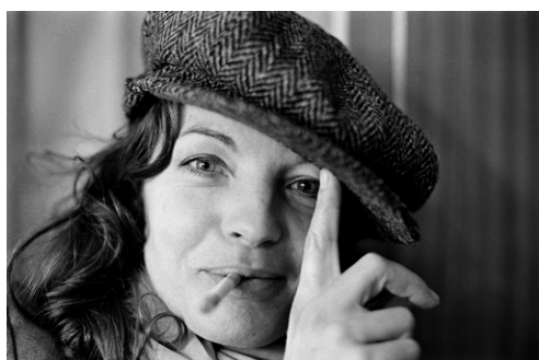
Romy Schneider in einer Drehpause, Berlin 1976

Berliner Originale VOL. I: Robert Lebeck