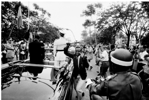
Ein Kongolese entreißt König Baudouin von Belgien den Degen, Leopoldville 1960

Berliner Originale VOL. I: Robert Lebeck