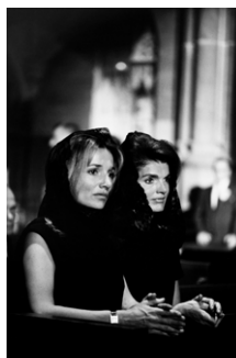
Jackie Kennedy und Lee Radziwill am Sarg von Robert Kennedy, New York 1968