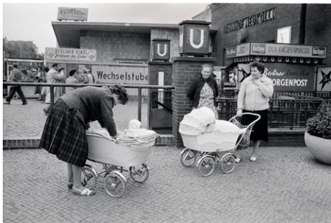
Karl-Marx-Strasse, Berlin-Neukölln 1960