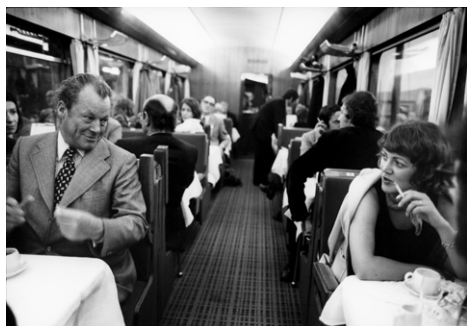
Willy Brandt im Speisewagen auf Wahlkampfreise, Süddeutschland 1973