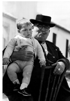
Großvater und Enkel, in Sevilla, Spanien 1964