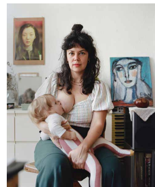
Maria Sturm, Fotografin