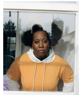
Sky Deep, Produzentin, DJane und Filmemacherin