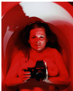
Katharina Bosse, Fotografin

https://www.dropbox.com/sh/0w5buznh3btmql/AACTdJZdK_Hhhdhhto0Ia1FNna?dl=0