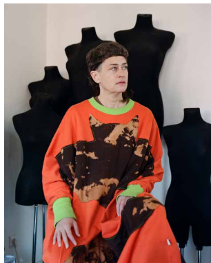
Peaches, Sängerin und Produzentin