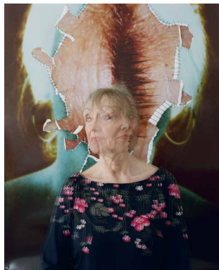
Annegret Soltau, Künstlerin

https://www.dropbox.com/sh/0w5buznh3btmqxl/AACTdJZdK_Hhhdhhto0Ia1FNn?dl=0