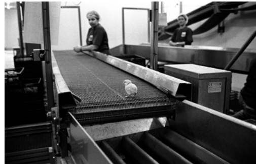
© Jan van Ijken | Precious Animals